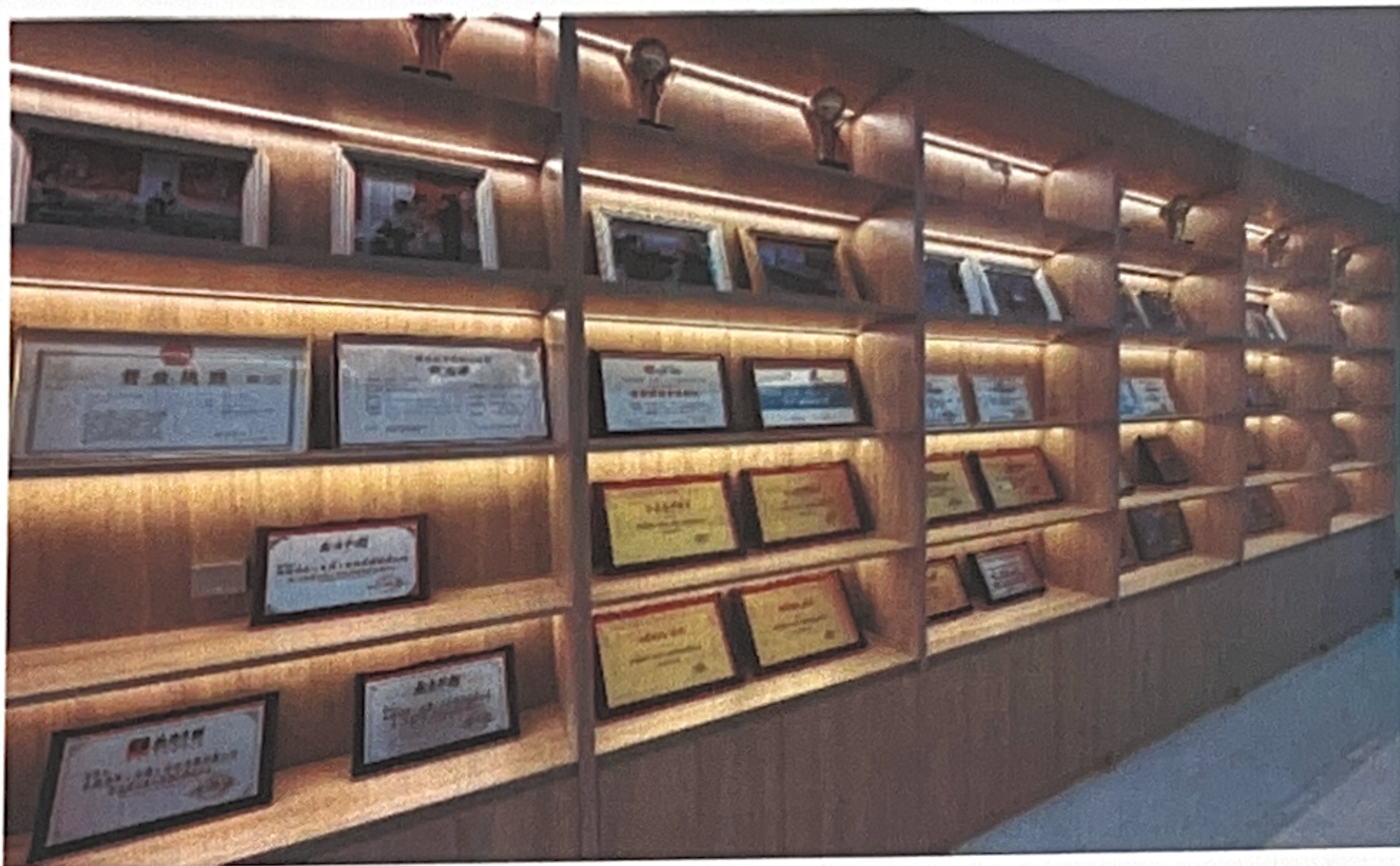
图 1. 公司近几年取得的荣誉

自 2021 年起，公司与天津交通职业学院正式建立校企合作关系，聚焦文化传媒行业技术技能人才需求，通过实习实训、课程共建、人才输送等多元形式，深度参与高等职业教育人才培养过程，形成了独具特色的校企协同育人模式，成为学校稳定的实践教学基地和人才就业合作单位。